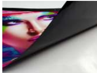
VINIL BLACK OUT